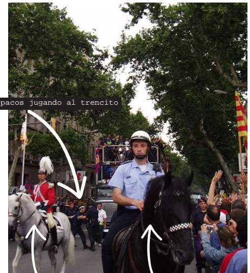
pacos jugando al trencito

2.nada como una buena carta de reclamación y un certificado de ingresos hecho por mi mismo, ya tengo de regreso lo que me robaron de mi cuenta, eso si la campaña sigue, si quieres incluir la tuya cuéntanos tu historia!!!, desahogate!!!! y entre todos hundiremos a al compañía en cuestión!!!