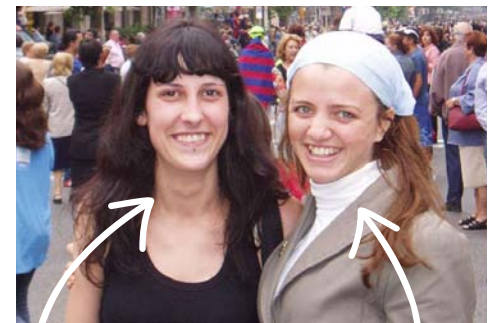
la Anna diseñadora Artis